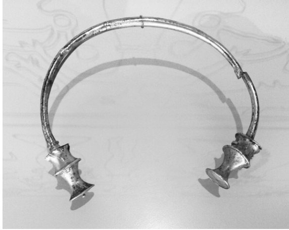
Fig. 4. Torques (güei nel Muséu Arqueolóxicu d'Asturies), estos collares enterizos lleguen tomaos por aldabiellones, ases de calderos, tiradores de caxón o canteses de madreñes

Volviendo a bruxes y aldovinos, volvemos atopar otra hestoria, esta vez venciyada al pueblu de Chanu, nel conceyu de Cangas del Narcea.