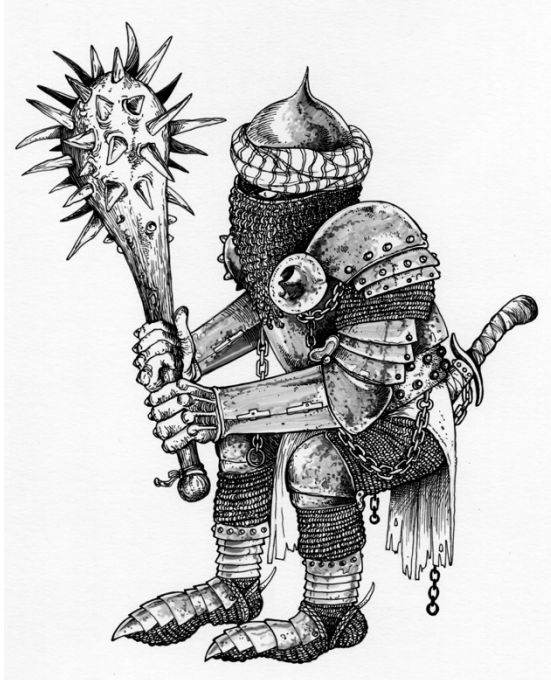
Fig. 3. En delles gacetes fálase de xigantes de fierro armaos con maces guardando’l tesoru